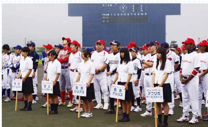
▲第19回 DREAM CUP

日 時 平成27年7月4日(土)～5日(日) 大会名 第19回 DREAM CUP 会 場 裾野市総合運動公園野球場・ トヨタ野球場 参加者 165人