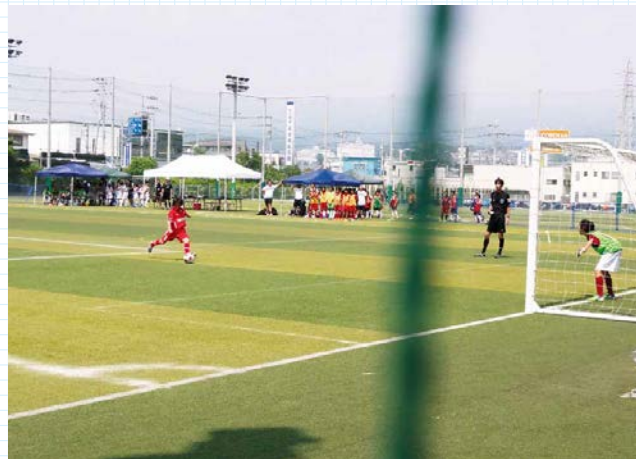
▲2015静岡カップ第1回女子トレセン (U-12) 選抜サッカー大会

日 時 平成27年9月10日(木)～11日(金) 大会名 関東ブロック労働委員会三者連絡協議会 会 場 プラサヴェルデ 参加者 120人