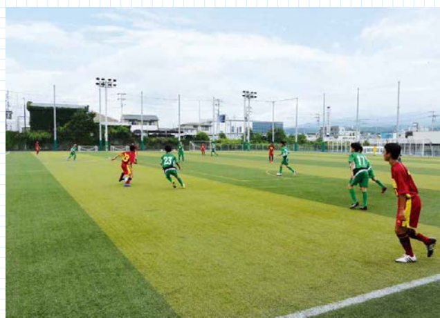
▲アスクラロSummer cup U-11