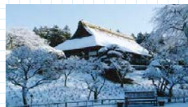
▲雪化粧の秩父宮記念公園