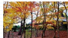
▲秋の秩父宮記念公園